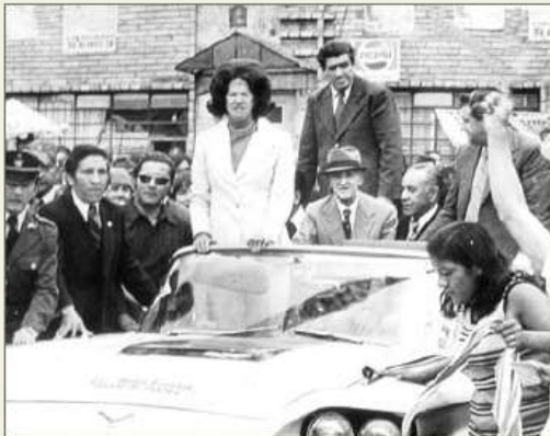
Gustavo Rojas Pinilla con su hija María Eugenia Rojas, líderes de la Anapo.

La Anapo fue otro de los partidos que hizo oposición al Frente Nacional desde la legalidad. Liderada por el ex general Rojas Pinilla, trascendió en el escenario político nacional como una alternativa al bipartidismo. Promovió una revolución de corte nacionalista, católica y socialista. Este partido contó con el apoyo de las clases medias, miembros de los dos partidos tradicionales, algunos socialistas y sectores del ejército.