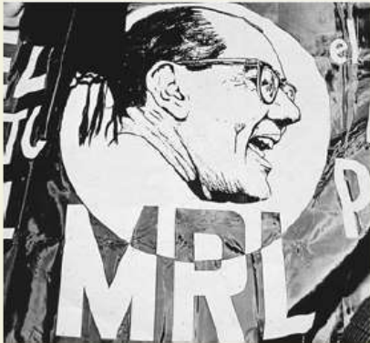
Bandera del MRL

El MRL, encabezado por el liberal Alfonso López Michelsen, logró posicionarse estratégicamente a comienzos de la década de 1960. A través del periódico "La Calle", esta disidencia del liberalismo difundió sus planteamientos políticos, que apuntaban, básicamente, a hacerle oposición al Frente Nacional.