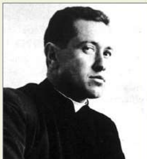
El cura Camilo Torres Restrepo, líder del Frente Unido.

El Frente Unido fue un movimiento social, fundado el 22 de mayo de 1965, y liderado por el sacerdote y sociólogo Camilo Torres Restrepo , opositor al Frente Nacional. Este movimiento social se caracterizó por demandar transformaciones en todos los niveles de la sociedad. Impulsó iniciativas que promovían la abstención electoral, como estrategia para desestabilizar la coalición bipartidista. Nutrió sus filas con estudiantes universitarios, comunidades católicas populares y diversos sectores de la clase media. Se disolvió en 1966, cuando el cura Camilo Torres ingresó a la guerrilla del Ejército de Liberación Nacional, Eln.