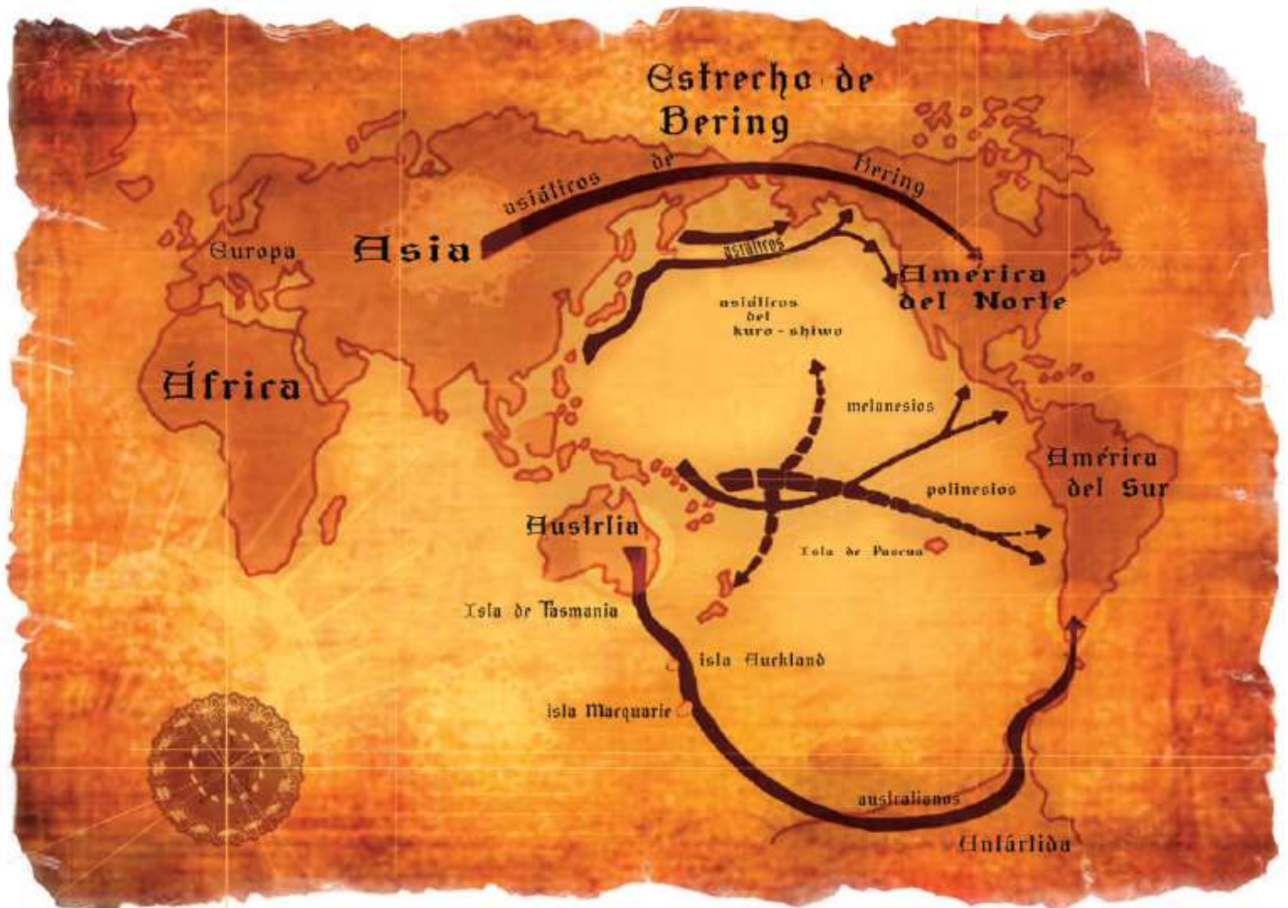
Rutas del poblamiento de América.

Otra teoría es la ruta del Atlántico, que sostiene que el hombre habría cruzado el océano Atlántico desde Europa. Esta teoría se basa en las similitudes halladas entre las herramientas elaboradas por la cultura Clovis en Norteamérica y las fabricadas por las primeras comunidades europeas.