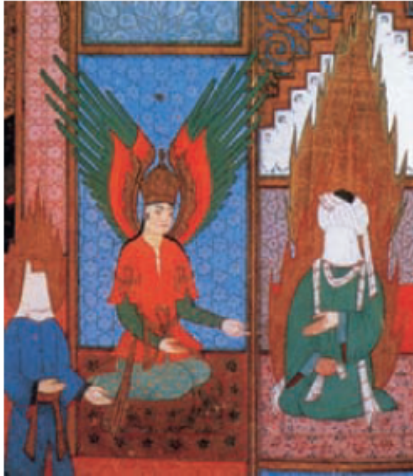
Aparición del arcángel Gabriel a Mahoma. Ilustración de un manuscrito persa del siglo XIV.

La nueva religión fue llamada islam , que significa “sumisión”, y sus seguidores fueron denominados musulmanes , “los sometidos a la voluntad de Dios”. Esta religión se fundamenta en cinco pilares que deben cumplir los creyentes: la profesión de fe basada en que solo hay un Dios y Mahoma es su profeta; la oración cinco veces al día; el ayuno en el mes de Ramadán; la limosna y la peregrinación a La Meca al menos una vez en su vida. Las enseñanzas de Mahoma quedaron plasmadas en el Corán, libro sagrado del islam.