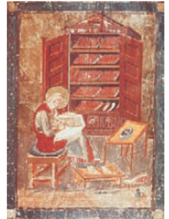
Monje copista. Ante la inexistencia de imprentas, ellos se encargaron de copiar, ordenar y arreglar los libros antiguos deteriorados y los nuevos.

La conversión al catolicismo de estos reinos consolidó la importancia de la Iglesia.