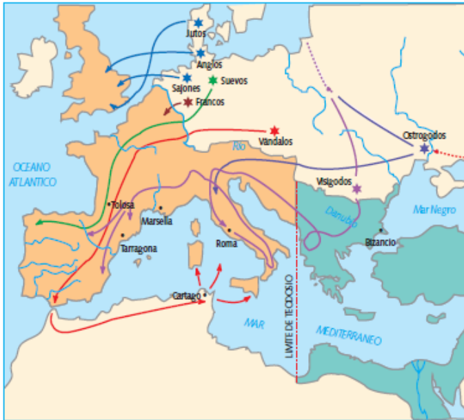
Las migraciones de los pueblos bárbaros.