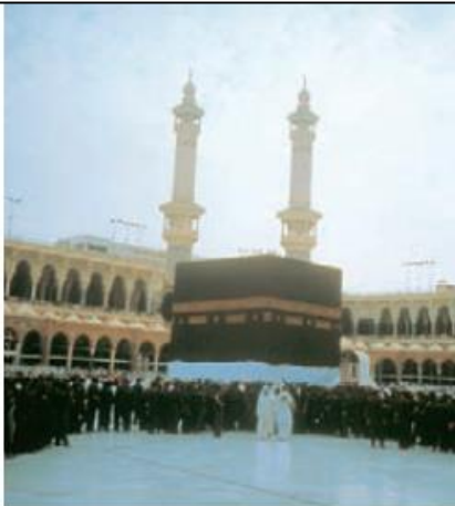
La Meca en un día de peregrinación, en el centro se ve la Kaaba.

La base de la organización social de los árabes era tribal. Cada tribu tenía sus propias creencias, pero la mayoría rendía culto a una misteriosa piedra negra (un aerolito) que se conserva en el santuario de La Kaaba, situado en la ciudad de La Meca. Según la tradición, la piedra era blanca y comenzó a cambiar de color por los pecados de los hombres.