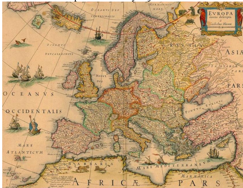
Ilustración 1. Mapa del mundo conocido en la Edad Media.

Con la caída del Imperio romano de occidente, comenzó el período conocido como la Edad Media, el cual abarcó diez siglos, desde el año 476 hasta el año 1453. Esta época se dividió en dos grandes etapas: la Alta y la Baja Edad Media . La primera comenzó en el año 476 y se extendió hasta el año 1000; la segunda duró del año 1000 al 1453. Durante la Alta Edad Media se presentaron invasiones de pueblos llamados bárbaros , en los territorios de la antigua Roma. También surgieron tres grandes imperios: el Bizantino, el Islámico y el Carolingio, cuyas relaciones y conflictos reestructuraron el mapa del mundo y dejaron su huella hasta nuestros días.