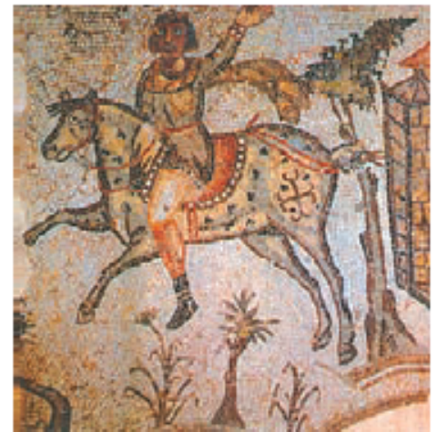
Vándalo a caballo. Mosaico de una villa de Cartago, hacia el año 500.

Gobernó en Italia hasta el año 493, cuando los ostrogodos aliados con el Imperio romano de oriente lo derrotaron.