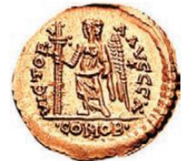
Monedas de Odoacro