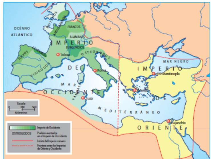
El Imperio romano a comienzos del siglo V.

La parte oriental del Imperio logró resistir los ataques de los invasores y se fue helenizando progresivamente, es decir, adoptando rasgos de la cultura griega. Por el contrario, la parte occidental sufrió un rápido proceso de decadencia, producto de la ruina de la vida urbana, las revueltas de campesinos y colonos, así como de las conspiraciones palaciegas. De ese modo, cuando nuevas invasiones bárbaras cayeron con fuerza sobre Occidente, dieron el golpe final a una estructura política profundamente debilitada. El último emperador del Imperio romano de Occidente fue destronado en el 476 por Odoacro, jefe de una tribu germánica. Con este hecho desapareció definitivamente el Imperio romano de Occidente y la grandeza de la ciudad que fuera capital de un imperio universal durante 700 años aproximadamente.