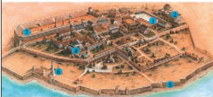
Plano de la ciudad de Constantinopla.